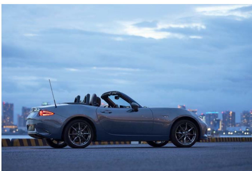
Mazda MX-5 RF 2.0L Sélection BVA avec option peinture Métallisée Machine Gray.