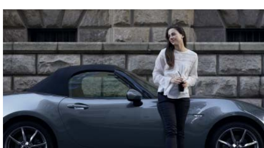
MX-5 ST Toit souple couleur noire