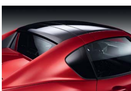
MX-5 RF Toit bi-ton optionnel (disponible sur MX-5 RF BVM)